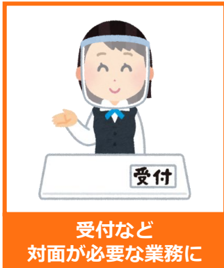
受付など 対面が必要な業務に