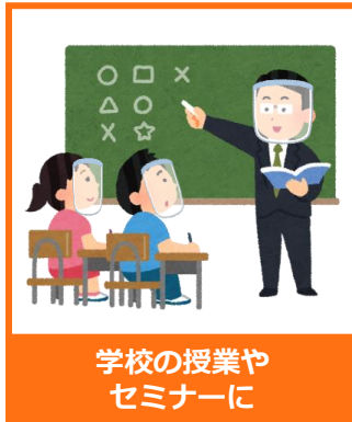
学校の授業や セミナーに