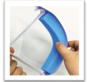
厚みのある スポンジクッション