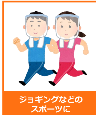
ジョギングなどの スポーツに