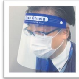
メガネの上から 着用できます